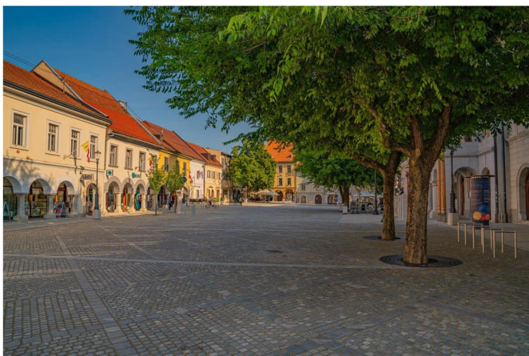
Slika: 2: Glavni trg