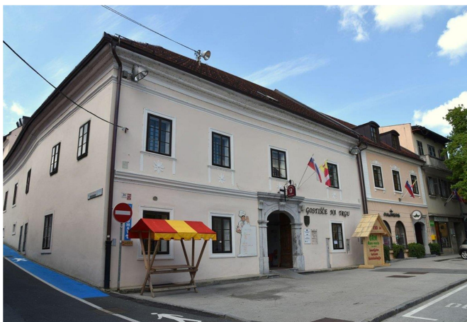
Slika: 5: Gostišče na trgu