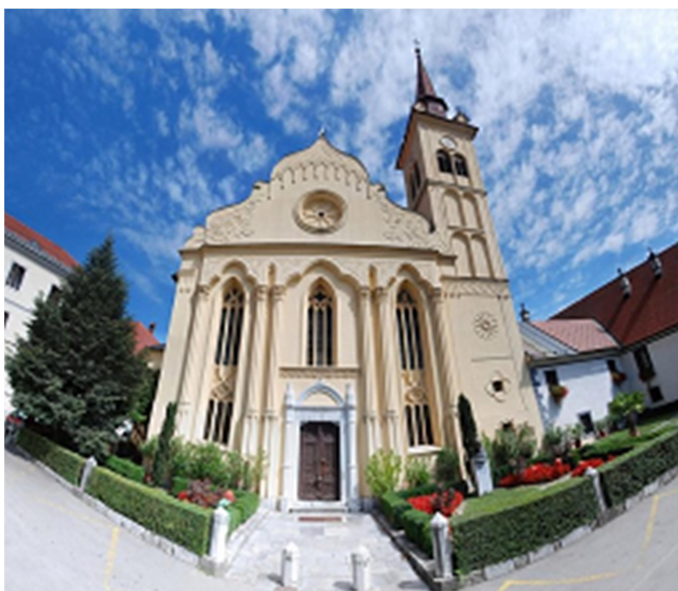
Slika: 6: Cerkev svetega Lenarta