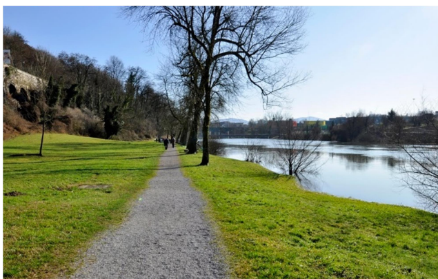
Slika: 7: Župančičevo sprehajališče