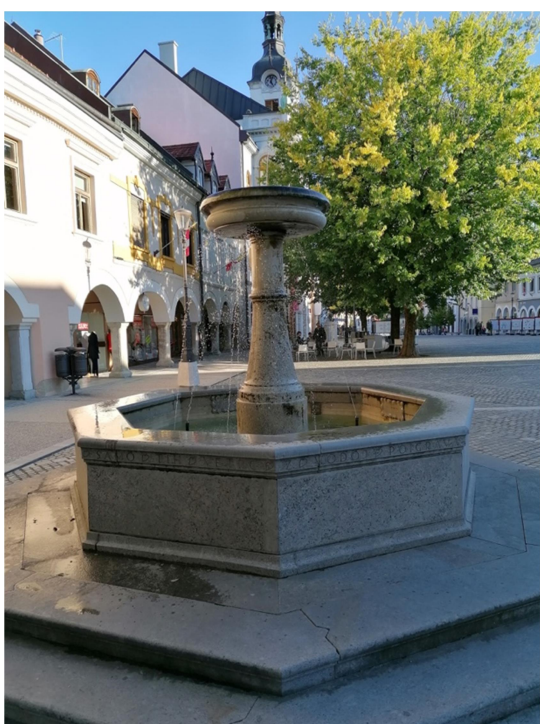
Slika: 4: Kettejev vodnjak