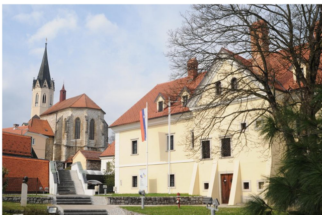
Slika: 8: Dolenjski muzej in cerkev svetega Miklavža