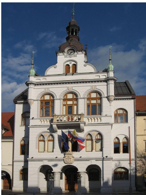
Slika: 3: Mestna hiša