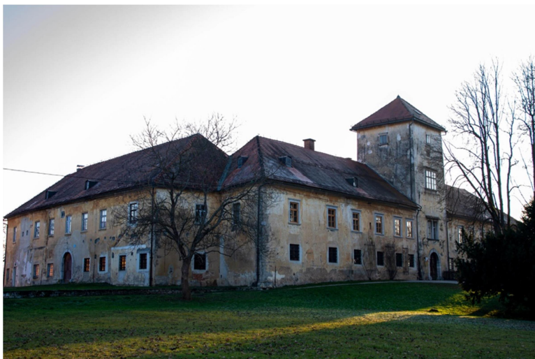
Slika: 1: Grad Grm