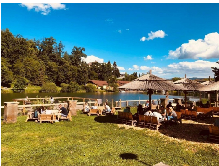
Slika: 9: Mestna plaža